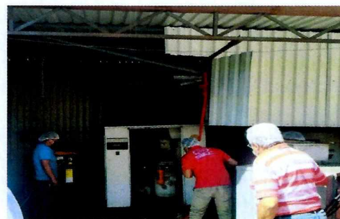
Imagen 2. Se observa cuarto de máquinas del establecimiento industrial

En relación con lo anterior, se notificó el citatorio con número de folio PAOT-05-300/210-368-2020, a fin de que la persona propietaria, encargada y/o representante legal del establecimiento ubicado en calle Centeno número 706, colonia Granjas México, Alcaldía Iztacalco, se presentara a comparecer, en las oficinas que ocupa esta Procuraduría. Al respecto, una persona que se identificó como persona autorizada del apoderado legal de "Empaques y acabados Litográficos S.A. de C.V.", se presentó a comparecer en las oficinas de esta Entidad, y se