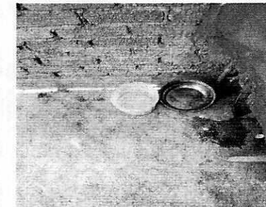
Fotografía 6. Recipientes para agua y alimento.

Finalmente, y considerando que no se detectaron signos de maltrato animal, se requirió al propietario de los ejemplares objeto de la presente denuncia a seguir cumpliendo con las condiciones adecuadas de bienestar respecto al alimento, agua, higiene, movilidad, alojamiento y comportamiento. Por lo anterior se da por concluida la investigación de conformidad con el artículo 27 fracción III de la Ley Orgánica de esta Procuraduría.