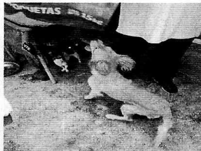
Fotografía 5 ejemplar canino motivo de denuncia de raza Golden Retriever.