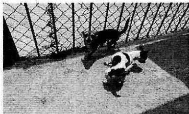
Fotografía 1. Ejemplares caninos motivo de denuncia de raza Chihuahua.