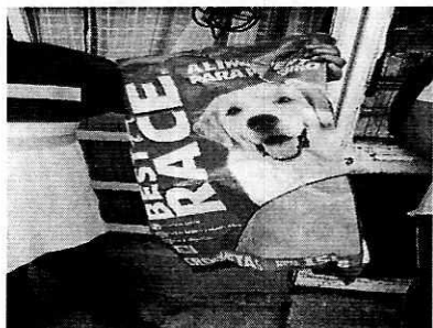
Fotografía 4. Alimento que les proporcionan a los ejemplares.