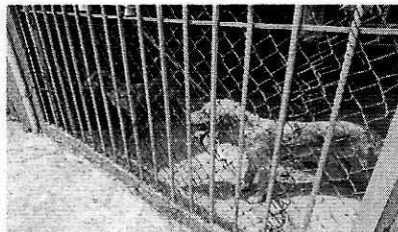
Fotografía 2. Ejemplares caninos motivo de denuncia de raza Golden Retriever.