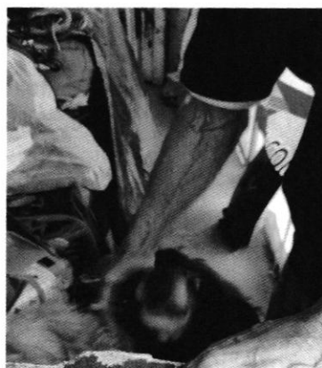
Fotografías 1 y 2.- Ejemplares denunciados.

Es de resaltar que, en el Acuerdo de Admisión, que fue enviado por correo electrónico a la persona denunciante, se le hizo de conocimiento que contaba con un término de seis días hábiles para aportar las pruebas que estimara pertinentes en la investigación de los hechos, lo anterior conforme al artículo 90 del Reglamento de la Ley Orgánica de la Procuraduría Ambiental y del Ordenamiento Territorial de la Ciudad de México; sin embargo durante el procedimiento de investigación, no fueron proporcionados elementos de prueba que pudieran determinar incumplimiento a la normatividad en materia de bienestar animal.