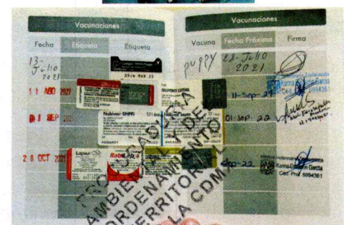
Fotografías 1-6.- Ejemplar denunciado y cartilla de vacunación.