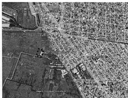
Ubicación del sitio de denuncia