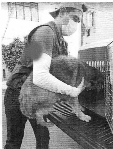
Figuras 1-2. Momento de la entrega voluntaria del ejemplar canino.