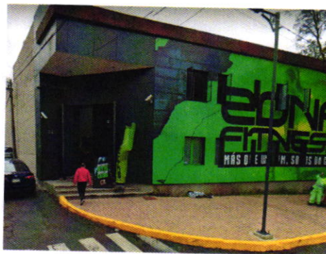
Se muestra el establecimiento motivo de la denuncia.

Por otra parte de acuerdo a las documentales que obran en el presente expediente, se desprende que personal de esta Subprocuraduría realizó un estudio técnico de emisiones sonoras desde el punto de denuncia, el cual tuvo como resultado que las actividades del establecimiento denunciado generan un nivel sonoro de 40.60 dB(A) , valor que no excede los límites máximos permisible de recepción establecidos en la Norma Ambiental NADF-005-AMBT-2013.