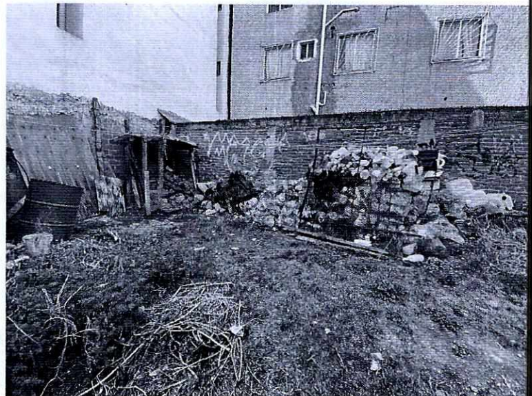
Imagen 2. Lugar donde se encontraba el ejemplar canino.

En virtud de lo antes expuesto, esta Entidad considera procedente emitir la presente resolución, de conformidad con el artículo 27 fracción VI de la Ley Orgánica de esta Procuraduría, por imposibilidad material, en virtud de que dejaron de existir los hechos denunciados, al ya no encontrarse el ejemplar canino en el lugar de la denuncia.