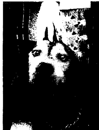
Fotografías 1-3. Muestran ejemplar canino motivo de denuncia

Al respecto, se presentó a comparecer en las oficinas de esta Procuraduría el propietario del ejemplar canino objeto de investigación, quien manifiesta tener su domicilio en Calzada San Bartolo Naucalpan número 86, Edificio 04, Departamento 412, Colonia Argentina Antigua, Alcaldía Miguel Hidalgo, diligencia en la que se hizo del conocimiento del personal de esta Entidad que el canino es alimentado con croquetas dos veces al día, el cual encuentra refugio al interior del inmueble, indicando que el perro cuenta con e