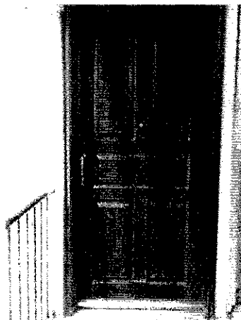
Fotografías 4-5. Muestran el sitio ubicado en Calzada San Bartolo Naucalpan número 86, Edificio 04, Departamento 412, Colonia Argentina Antigua, Alcaldía Miguel Hidalgo

En virtud de lo antes expuesto, esta Entidad considera procedente emitir la presente resolución, de conformidad con el artículo 27 fracción VI de la Ley Orgánica de esta Procuraduría, por imposibilidad material, al ya no encontrarse el ejemplar.