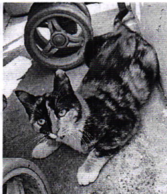
Fotografía 1. Vista del ejemplar felino que responde al nombre de “Manchas”.