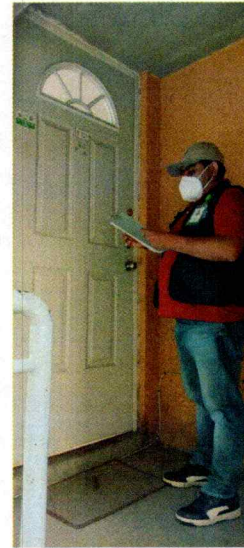
Fotografías 1 y 2.- Lugar de los hechos denunciados.

En seguimiento de lo anterior, personal de esta Subprocuraduría realizó una llamada telefónica a la persona propietaria del ejemplar canino motivo de denuncia, durante la cual informó que cambió de residencia, por lo que el ejemplar canino ya no se encontraba en ese lugar, toda vez y fue trasladado a otro inmueble, por lo que los hechos denunciados dejaron de existir.