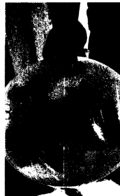
Fotografía 3.- Alimento.

Es de resaltar que, en el Acuerdo de Admisión, que fue enviado por correo electrónico a la persona denunciante, se le hizo de conocimiento que contaba con un término de seis días hábiles para aportar las pruebas que estimara pertinentes en la investigación de los hechos, lo anterior conforme al artículo 90 del Reglamento de la Ley Orgánica de la Procuraduría Ambiental y del Ordenamiento Territorial de la Ciudad de México; sin embargo durante el procedimiento de investigación, no fueron proporcionados elementos de prueba que pudieran determinar incumplimiento a la normatividad en materia de bienestar animal.