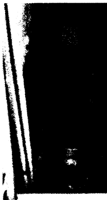
Fotografía 2.- Recipientes de agua.