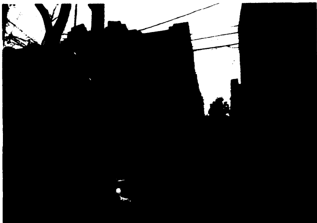
Imagen 1: PAOT Reconocimiento de hechos del 26 de febrero de 2019. Se observa la fachada del inmueble objeto de investigación.

Expediente: PAOT-2019-633-SOT-265 Y acumulado PAOT-2019-687-SOT-279