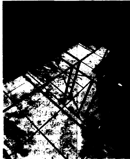
Imagen 4: PAOT RH 14 de junio de 2019

Se observan sellos de Clausura impuestos por la Alcaldía Cuauhtémoc en el acceso del departamento J.