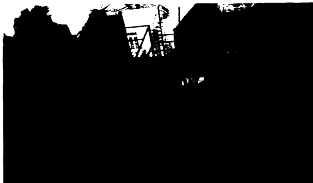
Imagen 2: PAOT Reconocimiento de hechos 26 de febrero de 2019. Se observa la instalación de la malla ciclónica y la estructura metálica en la azotea de los inmuebles objeto de investigación.

En razón de lo anterior, se giraron oficios al Propietario, Poseedor, Representante Legal y/o Director Responsable de Obra de los departamentos I y J del inmueble objeto de investigación, a fin de realizar las manifestaciones que conforme a derecho correspondan y presenten pruebas que acrediten la legalidad de la obra, sin respuesta. -----