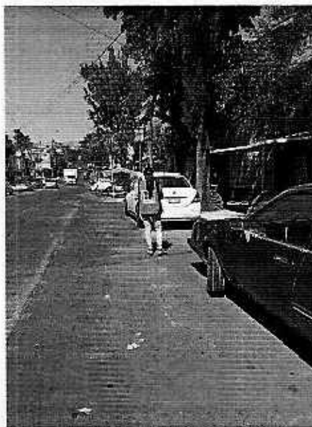
Imagen 2. Recorrido de la calle completa.

En seguimiento de lo anterior, personal de esta Subprocuraduría trato de entablar comunicación vía telefónica con la persona denunciante, sin embargo, en el número proporcionado en el escrito de denuncia no hubo respuesta, asimismo, se remitieron correos para entablar comunicación electrónica, sin obtener respuesta.