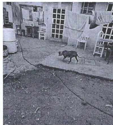
Figuras 1 y 2. Condiciones de alojamiento en donde se reubicó a los ejemplares caninos motivo de denuncia.

En virtud de lo antes expuesto, esta Entidad considera procedente emitir la presente resolución, de conformidad con el artículo 27 fracción VI de la Ley Orgánica de esta Procuraduría, por imposibilidad material, en virtud de que dejaron de existir los hechos denunciados, al ya no encontrarse los ejemplares caninos en el lugar de la denuncia.