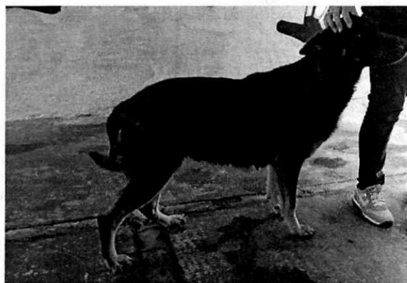
Vista del ejemplar canino.

No obstante, mediante el oficio correspondiente, se hizo del conocimiento del responsable del ejemplar canino objeto de investigación, las responsabilidades que se tienen que cumplir al tener animales de compañía, conminándolo a su debido cumplimiento.