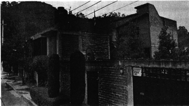
Google maps octubre 2011

En este sentido, de la información obtenida vía internet y de lo constatado en el reconocimiento de hechos, se advierte lo siguiente: -----