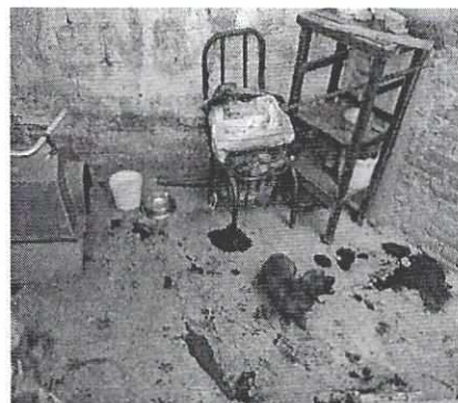
Figuras 4 a6. Condiciones de alojamiento constadas durante la visita de seguimiento.

En virtud de lo antes expuesto, esta Entidad considera procedente emitir la presente resolución, de conformidad con el artículo 27 fracción VII de la Ley Orgánica de esta Procuraduría, por el cumplimiento voluntario de las disposiciones jurídicas en materia de bienestar animal.