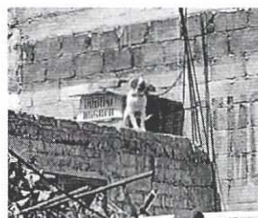
Figuras 1 a 3. Ejemplares caninos motivo de denuncia, en las condiciones constatadas durante la primera visita de reconocimiento de hechos.

En seguimiento de lo anterior, personal de esta Subprocuraduría llevó a cabo una nueva visita de reconocimiento de hechos, con la finalidad de dar seguimiento a las recomendaciones antes mencionadas, constatando que la persona encargada del cuidado de los caninos llevó a cabo las recomendaciones, garantizando que los ejemplares permanezcan libres de ataduras, mientras que a la canina "Sofía" se le reubicó en la planta baja, a fin de mantenerla segura y con un refugio adecuado.