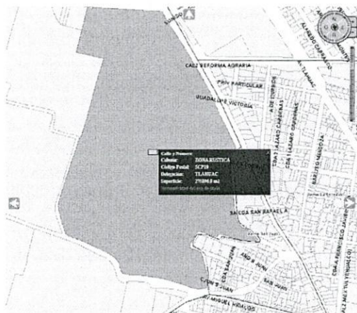
Imagen obtenida del SIG-CiudadMX de SEDUVI de poligonal de catastro del polígono correspondiente al sitio objeto de denuncia.

Así mismo, se realizó la consulta al Sistema de Información Geográfica de la Secretaría de Desarrollo Urbano y Vivienda de la Ciudad de México (SIG-SEDUVI), y se constató que el predio objeto de denuncia se localiza dentro del polígono de la cuenta catastral 757_046_01, que tiene una superficie de 275896 m 2 y le aplica la zonificación de RE (Rescate Ecológico), como a continuación se muestra: -----