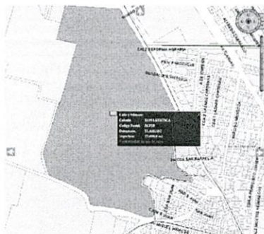
Imagen obtenida del SIG-CiudadMX de SEDUVI de poligonal de catastro del polígono correspondiente al sitio objeto de denuncia.

Así mismo, se realizó la consulta al Sistema de Información Geográfica de la Secretaría de Desarrollo Urbano y Vivienda de la Ciudad de México (SIG-SEDUVI), y se constató que el predio objeto de denuncia se localiza dentro del polígono de la cuenta catastral 757_046_01, que tiene una superficie de 275896 m 2 y le aplica la zonificación de RE (Rescate Ecológico), como a continuación se muestra: -----