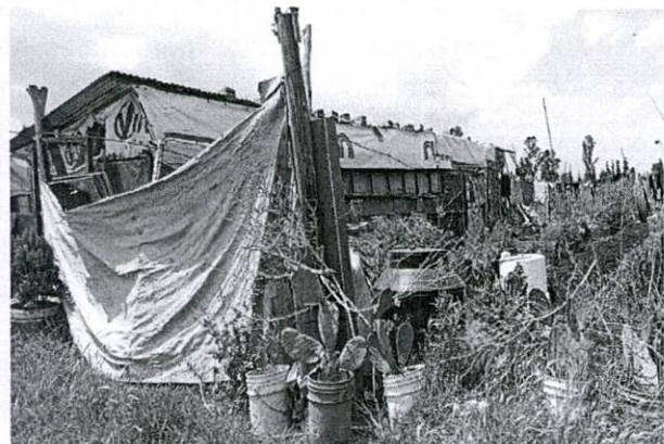
Imagen 1. Localización y registro fotográfico de visita de reconocimiento de hechos en el predio objeto de denuncia.