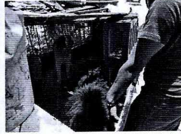
FOTOTGRAFÍA.- Vistas de los ejemplares caninos y del lugar de alojamiento.

Mediante oficio se hizo del conocimiento de la persona responsable de los ejemplares caninos objeto de investigación, las responsabilidades que se tienen que cumplir al tener animales de compañía, conminándola a su debido cumplimiento.