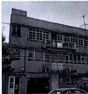
FOTOGRAFÍA.- Vista de la fachada del inmueble.

En este sentido, de las constancias que obran en el expediente en el que se actúa, se desprende que personal de esta Subprocuraduría realizó el reconocimiento de hechos correspondiente en el domicilio descrito en la denuncia, percatándose de que dicho inmueble se conforma de diversos interiores, sin que fuera posible ubicar a algún ejemplar canino con las características señaladas en la denuncia en los balcones con que cuenta el referido inmueble.