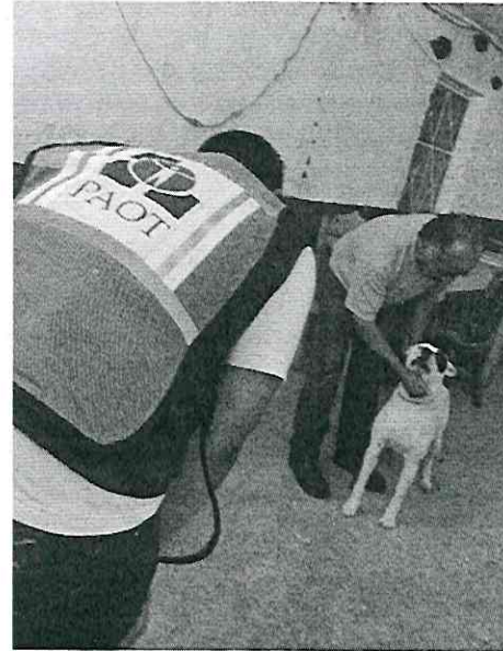
Imagen 2. Ejemplar de nombre "Princesa".