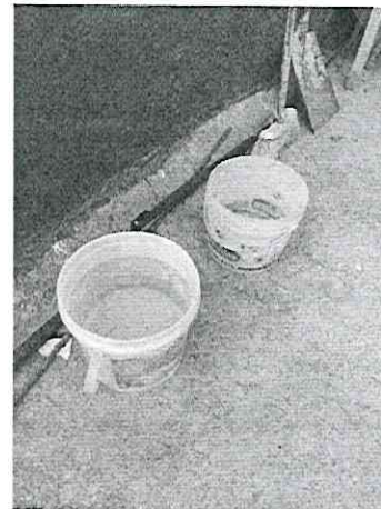
Imagen 4. Recipientes con agua.