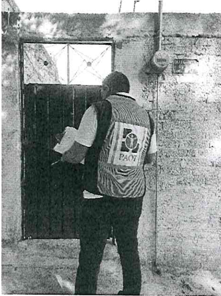
Imagen 1. Fachada del sitio de denuncia.