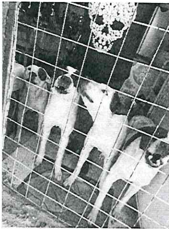
Imagen 3. Ejemplares "linda", "manchitas"