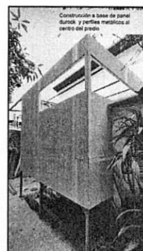
RECONOCIMIENTO DE HECHOS: 25 DE NOVIEMBRE DE 2021

Esta Subprocuraduría, emitió oficio dirigido al Propietario, Representante Legal, Poseedor y/o Responsable de la Obra del inmueble objeto de investigación, a efecto de que realizara las manifestaciones que conforme a derecho corresponden y presentara las documentales que acreditaran la legalidad de los trabajos de construcción; por lo que mediante oficio de fecha 02 de diciembre de 2021, una persona que se ostentó como poseedor del inmueble informó que sólo se realizan trabajos de instalación de un sistema de reciclamiento de aguas grises y recuperación de aguas pluviales. -----