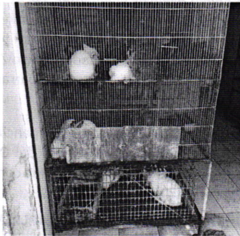
Fotografía 1. Vista de los conejos observados en el sitio referido en el escrito de denuncia.

Aunado a lo anterior, y con la finalidad de contar con mayores elementos, se citó a comparecer a la persona encargada del establecimiento mercantil en comento, quien se presentó en las oficinas de esta Procuraduría, comprometiéndose a ampliar los espacios en los cuales se encuentran los conejos, así como a proporcionarles los cuidados de bienestar animal correspondientes.