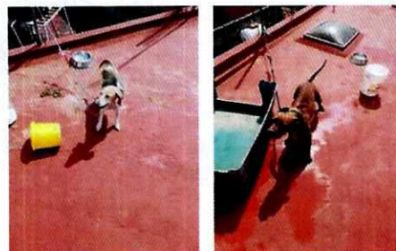
FOTOGRAFÍAS.- Vista de los ejemplares caninos