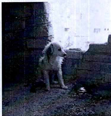
FOTOGRAFÍA.- Vista del lugar donde se aloja el ejemplar canino.

En virtud de lo antes expuesto, es de señalar que derivado de la intervención de esta Procuraduría: