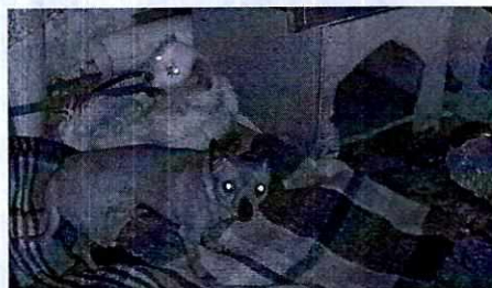
FOTOGRAFÍA.- Vista del lugar donde se alojan los ejemplares caninos.

Mediante el oficio correspondiente, se informó a la responsable de los ejemplares caninos, las obligaciones que prevé la Ley de Protección a los Animales de la Ciudad de México al contar con animales de compañía.