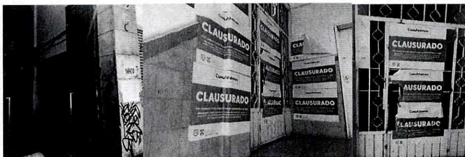
FOTOGRAFÍAS.- Vista de la fachada del inmueble así como del interior 201, el cual contaba con sellos de clausura.

Derivado de lo anterior, esta Subprocuraduría, solicitó a las personas denunciantes informaran si los hechos denunciados continuaban presentándose, proporcionando en su caso, los horarios en que es factible encontrar a alguna persona que atienda la diligencia, sin que a la fecha de emitir la presente resolución, se tenga información alguna, por lo que al no contar con mayores elementos para seguir con la investigación, esta Subprocuraduría queda imposibilitada legal y materialmente para continuar con la misma, dándose por concluida en apego al artículo 27 fracción VI de la Ley Orgánica de la Procuraduría Ambiental y del Ordenamiento Territorial de la Ciudad de México.