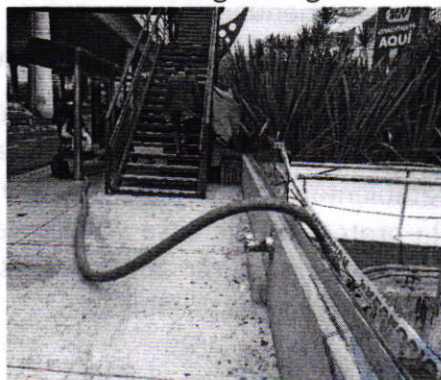
Fotografía 1. Vista del Centro Comercial Adora Pedregal.

En este sentido, personal de esta Subprocuraduría realizó visita de reconocimiento de hechos de acuerdo a lo establecido en el artículo 15 BIS 4 fracción IV de la Ley Orgánica de esta Entidad, en la cual se entrevistó con una persona empleada del centro comercial en comento, quien manifestó que han contratado el servicio de pipas, toda vez que no cuentan con un suministro constante de agua, motivo por el cual colocaron en la cisterna del sitio, una manguera que desemboca hacia la vía pública, la cual es conectada a la pipa cuando llega a descargar el líquido vital. Cabe señalar que desde el espacio público no se constató la descarga de aguas residuales.