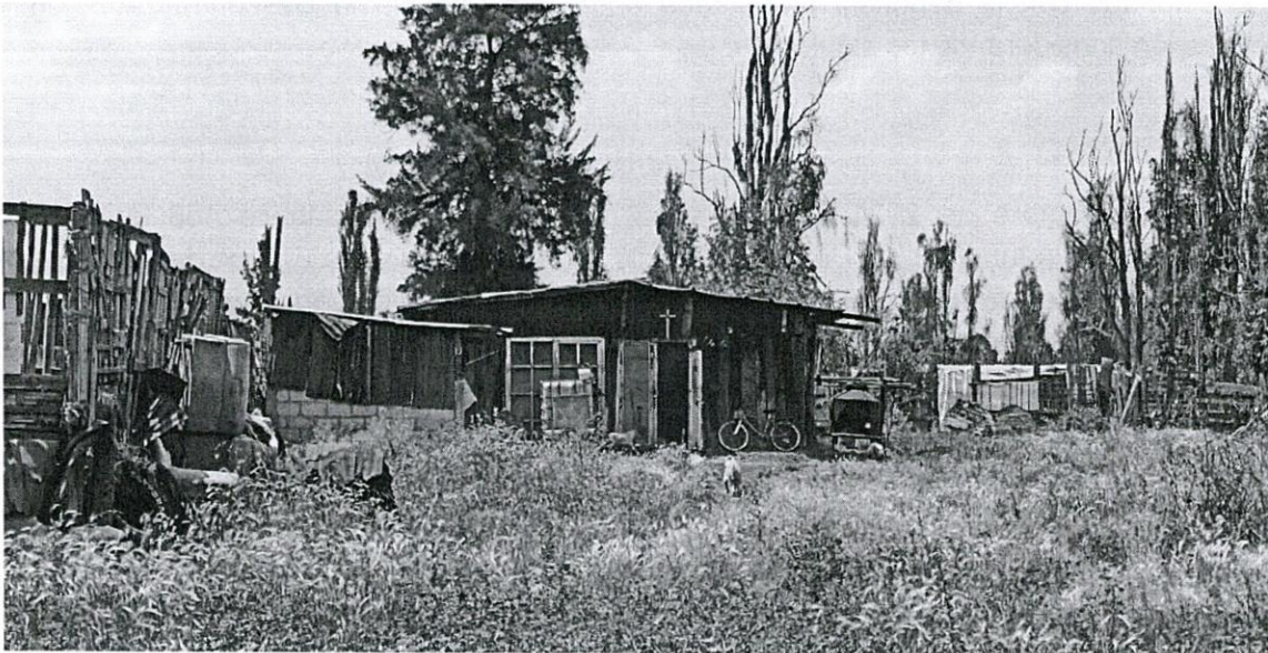
Imagen 1. Localización y registro fotográfico de visita de reconocimiento de hechos en el predio objeto de denuncia.

Sobre el particular, personal de esta Subprocuraduría se constituyó en las inmediaciones del sitio denunciado ubicado en el paraje Comalpa Chinanco, también conocido como Atacuyoc, en la Ciénega Chinampera de San Pedro Tláhuac, Alcaldía Tláhuac, en las coordenadas 499137, 2131037, con la finalidad de realizar el reconocimiento de los hechos denunciados, diligencia de la cual se levantó el acta circunstanciada correspondiente en la que se hizo constar que se identificó una casa de materiales semipermanentes con cubierta de lámina a dos aguas con revestimiento de madera, misma que se encuentra habitada. (Ver Imagen 1). -----