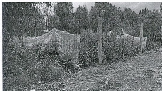
Imagen 1 y 2. Localización y registro fotográfico de visita de reconocimiento de hechos en el predio objeto de denuncia.