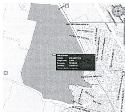
Imagen obtenida del SIG-CiudadMX de SEDUVI de poligonal de catastro del polígono correspondiente al sitio objeto de denuncia.

Así mismo, se realizó la consulta al Sistema de Información Geográfica de la Secretaría de Desarrollo Urbano y Vivienda de la Ciudad de México (SIG-SEDUVI), y se constató que el predio objeto de denuncia se localiza dentro del polígono de la cuenta catastral 757_046_01, que tiene una superficie de 275896 m 2 y le aplica la zonificación de RE (Rescate Ecológico), como a continuación se muestra: -----