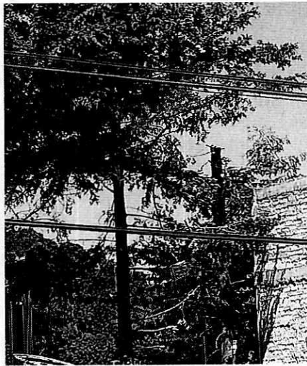
Fotografías 1 y 2. Árboles afectados, ramas laterales (izquierda) y desmoche (derecha).