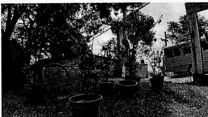
Fotografía 3. Se muestran los árboles con los que se compensó el daño a la biomasa vegetal.