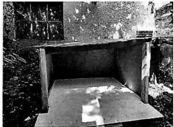
Fotografía 4. Sitio de refugio del ejemplar canino.

Finalmente, se tiene que se constató la falta de un refugio adecuado, una condición corporal delgada y lesiones en el ejemplar canino motivo de la denuncia, por lo que haciendo valer el cumplimiento voluntario se logró que el responsable llevara a cabo las acciones necesarias para mejorar sus condiciones de bienestar animal, por lo que se da por concluida la investigación de conformidad con el artículo 27 fracción VII de la Ley Orgánica de esta Procuraduría.