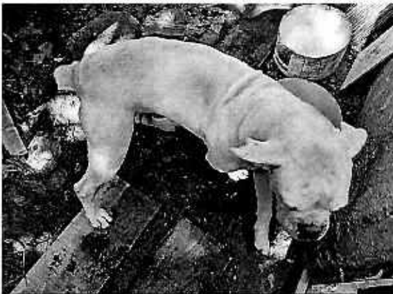
Fotografía 3. Ejemplar canino con una condición corporal ideal de acuerdo a su talla.