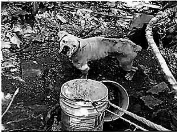
Fotografía 1. Vista del ejemplar canino que responde al nombre de "Daysi".

En este sentido, de las constancias que obran en el presente expediente, se desprende que personal de esta Subprocuraduría llevó a cabo una visita de reconocimiento de hechos, de acuerdo a lo establecido en el artículo 15 BIS 4 fracción IV de la Ley Orgánica de esta Entidad, diligencias en la cual se constató lo siguiente: