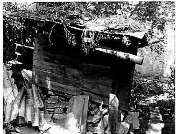
Fotografía 2. Lugar de refugio del ejemplar canino.