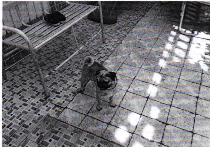
Fotografía 2. Vista del ejemplar canino motivo de denuncia.

En seguimiento a la denuncia, se realizó un reconocimiento de hechos por personal adscrito a esta Subprocuraduría, durante el cual se constató que derivado del cumplimiento voluntario por parte de la persona propietaria del animal de compañía que responde al nombre de "Gorda", actualmente deambula libremente en el patio techado del inmueble en comento, el cual tiene una superficie aproximada de 150 m 2 , el cual le permite tener la movilidad suficiente de acuerdo a su talla.