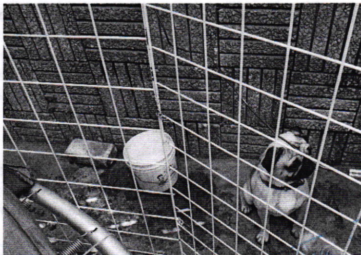
Fotografía 1. Vista del ejemplar canino que responde al nombre de "Gorda"