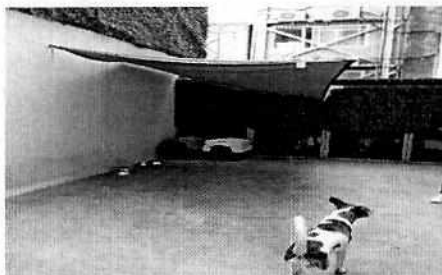
FOTO 3. Patio posterior, donde cuentan con casas para perro.

Al respecto, mediante oficio, se solicitó a la persona denunciante, de conformidad con lo establecido en el artículo 91 del Reglamento de la Ley Orgánica de esta Entidad, aportara mayores elementos de pruebas que permitieran constatar los actos de maltrato denunciados, sin embargo el denunciante refirió que a partir de la intervención de esta entidad, la problemática motivo de denuncia dejó de presentarse, surtiendo efecto el haber acudido a esta Procuraduría. Por lo que no se cuenta con elementos suficientes que acrediten un posible incumplimiento a la legislación en materia de bienestar animal vigente.