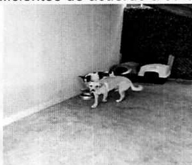
FOTO 1. Ejemplares caninos motivo de la denuncia.