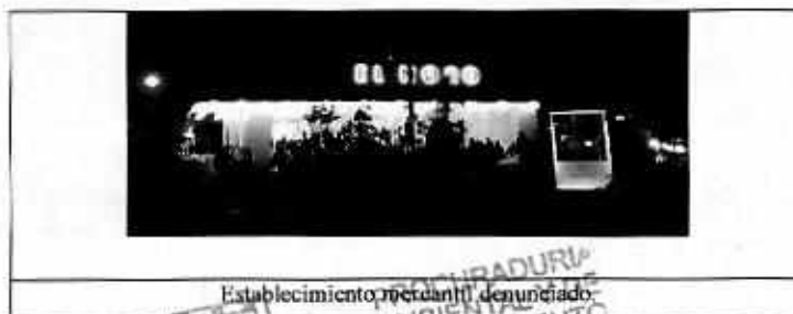
Establecimiento mercantil denunciado

En este sentido, personal investigador a cargo de la denuncia realizó nuevo reconocimiento de hechos, durante el cual no constató emisiones de partículas a la atmósfera derivadas de las actividades comerciales del establecimiento mercantil denominado "Churrería El Moro".