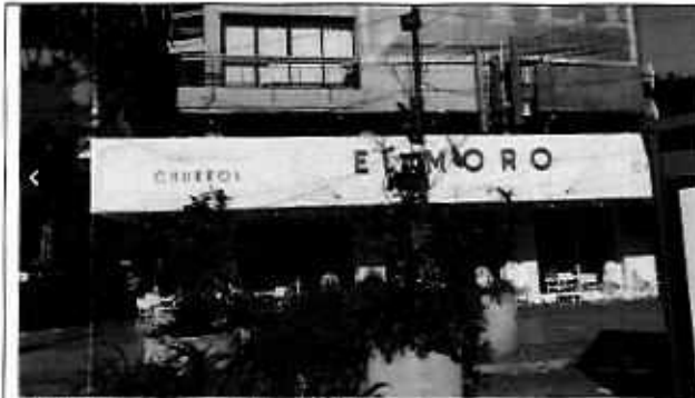
Establecimiento mercantil denunciado.