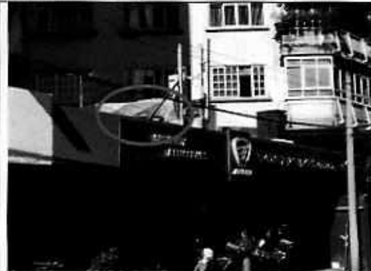
Desde la vía pública no se constataron las emisiones de partículas a la atmósfera.

Asimismo, mediante correo electrónico el representante legal del sitio motivo de denuncia remitió copia simple de la Orden de Acto de Inspección Ordinario y el acta respectiva emitidas por la Dirección General de Inspección y Vigilancia Ambiental de la Secretaría del Medio Ambiente de la Ciudad de México, ambas de fecha 8 de octubre de 2019 y con número de folio DGIVA/08911/2019 del expediente DC-163/2019, así como, copia simple del acuerdo de fecha 24 de octubre de 2019 con número de folio SEDEMA /DGIVA/09390/2019 y el requerimiento de pago para emisión de LAU-CDMX de fecha 2 de diciembre de 2019 con número DGEIRA/DRRA/1674/2019, documentales en la que se describe que la Secretaría del Medio Ambiente realiza un procedimiento administrativo en materia ambiental al establecimiento mercantil de mérito.