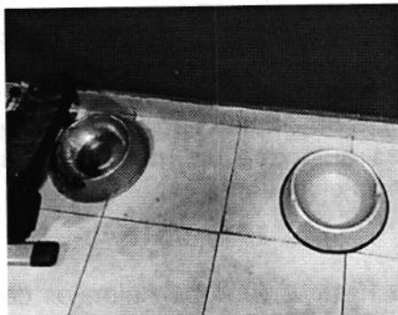
Fotografías 3 y 4. Recipientes con agua limpia.