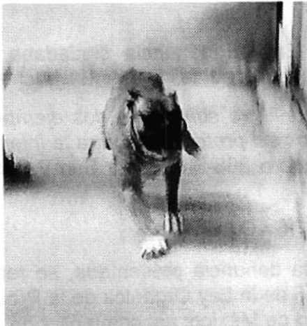
Fotografías 1 y 2. Ejemplares caninos motivo de la presente investigación.