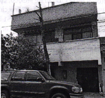
Fotografía 1. Vista del sitio referido en el escrito de denuncia".

En este sentido, personal de esta Subprocuraduría realizó dos reconocimientos de hechos de acuerdo a lo establecido en el artículo 15 BIS 4 fracción IV de la Ley Orgánica de esta Entidad, en los cuales desde el espacio público no se constató la existencia del ejemplar canino referido en el escrito de denuncia, ni ladridos provenientes del interior del inmueble de referencia u olores característicos de la presencia de dicho animal.