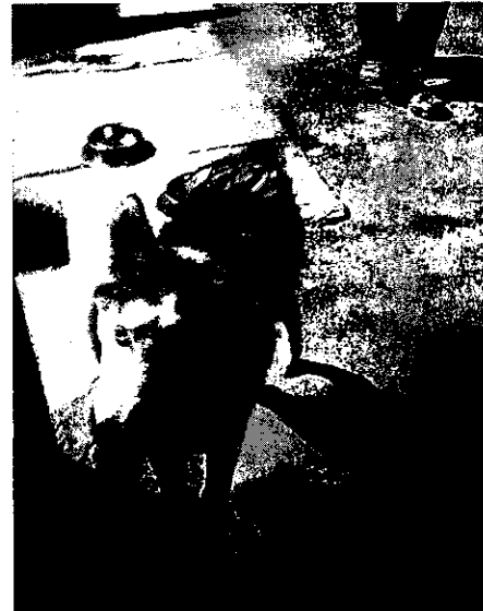
Imágenes de los ejemplares caninos objeto del presente instrumento.

No obstante, esta Subprocuraduría mediante el oficio correspondiente hizo del conocimiento de la persona habitante del domicilio referido, las disposiciones vigentes en materia de protección a los animales, conminándola a su debido cumplimiento.