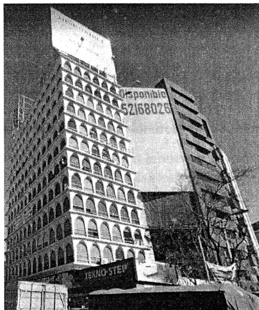
Imagen de fecha de enero de 2012