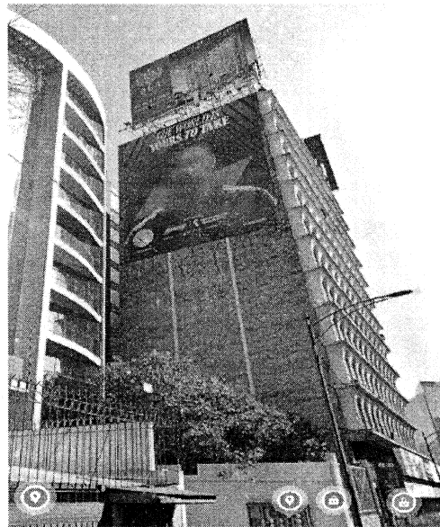
Imágenes de fecha de diciembre de 2022

Al respecto, el artículo 13 fracción VI de la Ley de Publicidad Exterior de la Ciudad de México, publicado en la Gaceta Oficial del Distrito Federal (ahora Ciudad de México), el 20 de agosto de 2010, dispone que quedan prohibidos los anuncios publicitarios integrados en lonas, mantas, telones, lienzos, y en general, en cualquier otro material similar, sujetos, adheridos o colgados en los inmuebles públicos o privados, sea en sus fachadas, colindancias, azoteas o en cualquier otro remate o parte de la edificación. -----