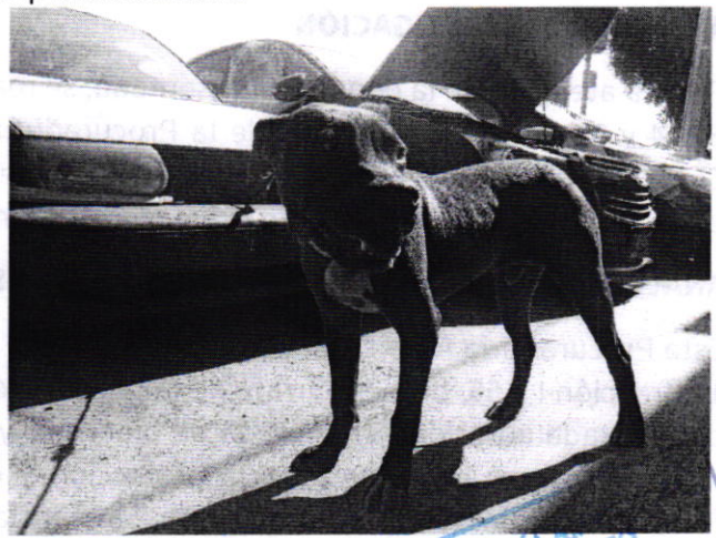
Fotografías 1 y 2. Vista de los ejemplares caninos motivo de denuncia.

En seguimiento a la denuncia, se realizó un segundo reconocimiento de hechos por personal adscrito a esta Subprocuraduría, en el cual se constató que derivado del cumplimiento voluntario