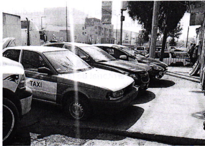
Fotografía 3. Vista del sitio en el cual se encontraban los ejemplares caninos motivo de denuncia.

por parte de la persona propietaria de los ejemplares caninos motivo de denuncia, fueron retirados de la vía pública y reubicados al municipio de Ixtapaluca, en el Estado de México, con la finalidad de mejorar sus condiciones de bienestar.