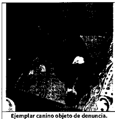
Ejemplar canino objeto de denuncia.

Finalmente, se hizo del conocimiento de la persona responsable del ejemplar canino en comento, la legislación en materia de bienestar animal conminándola a su debido cumplimiento.