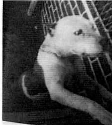
Vista del ejemplar canino que tuvo cachorros antes y como se encuentra actualmente.

En una vista de reconocimiento de hechos subsecuente, realizada por personal médico veterinario adscrito a esta unidad administrativa, se constató que el ejemplar canino de raza pitbull, actualmente muestra una condición corporal (3/5), acorde a su talla y raza, la cual es alojada en el segundo nivel de la casa, donde deambula libremente y cuenta con protección contra la intemperie, así como con agua a libre acceso.