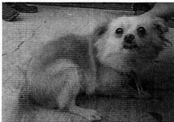
Vista de los dos ejemplares caninos que demabulan libremente por el patio de la casa y al interior de la misma