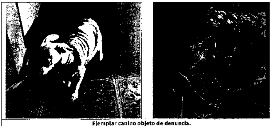
Ejemplar canino objeto de denuncia.

Finalmente, se hizo del conocimiento de las personas responsables del ejemplar canino en comento, la legislación en materia de bienestar animal conminándolas a su debido cumplimiento.