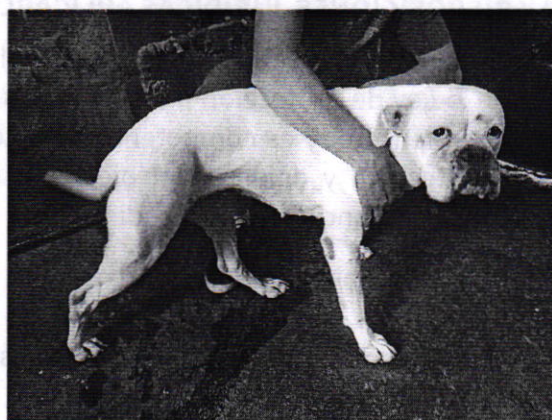
Fotografía 1. Vista del ejemplar canino que responde al nombre de "Medusa"

Aunado a lo anterior, y con la finalidad de contar con mayores elementos, se citó a comparecer a la persona propietaria del ejemplar canino motivo de denuncia, quien se presentó en las oficinas de