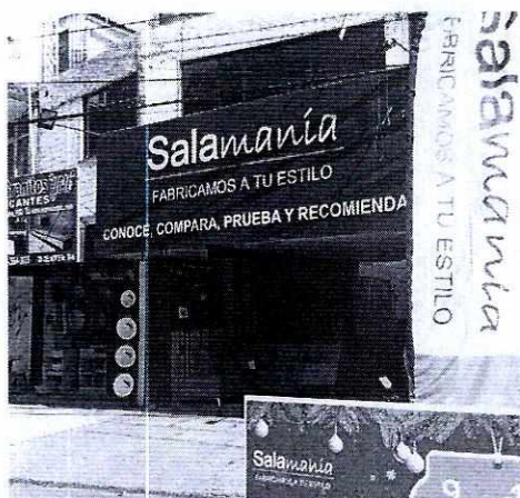
Fotografía 1. Fachada del establecimiento.

Por lo anterior, mediante oficio se citó a comparecer en las oficinas que ocupa esta unidad administrativa al propietario y/o representante legal del establecimiento mercantil ubicado en División del Norte, número 3546, colonia Xotepingo, Alcaldía Coyoacán, con la finalidad de que manifestara lo que a su derecho corresponde; al respecto, se presentó el gerente de la referida negociación, quien mediante acto de comparecencia manifestó que para la ambientación, ocupa una bocina, misma que genera emisiones sonoras de baja intensidad; sin embargo, de manera voluntaria redireccionaría dicha bocina hacia el interior del inmueble.