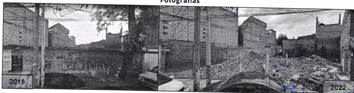
Fotografía 1 y 2. Árbol motivo de denuncia, fuente https://www.google.com.mx/maps , febrero 2019 (Izquierda) y mayo 2022 (derecha).

Por lo anterior, mediante oficio PAOT-05-300/200-4655-2023 se solicitó a la Dirección Ejecutiva de Desarrollo Sustentable de la Alcaldía Iztapalapa, que informara lo siguiente: