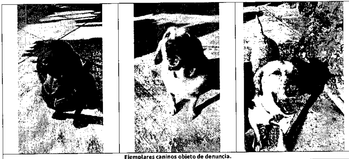
Ejemplares caninos objeto de denuncia.

Finalmente, se hizo del conocimiento de la persona responsable de los ejemplares caninos en comento, la legislación en materia de bienestar animal conminándola a su debido cumplimiento.