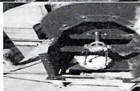
Se muestra la estructura de la fachada antes de la instalación