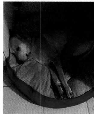
Imágenes del ejemplar canino motivo de la presente investigación

Medellín 202, piso 4, colonia Roma Sur Alcaldía Cuauhtémoc, C.P. 06000, Ciudad de México Tel. 5265 0780 ext 12011 Y 12400